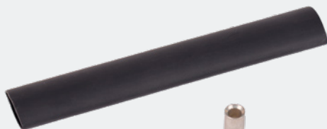
Universalverbinder 6 – 10 mm 2 10 Stk. / Beutel Art.-Nr. 2 00 656