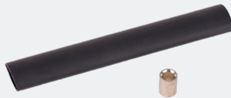
Universalverbinder 10 – 16 mm 2 10 Stk. / Beutel Art.-Nr. 2 00 657