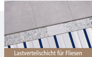
Lastverteilschicht für Fliesen