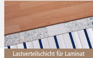
Lastverteilschicht für Laminat