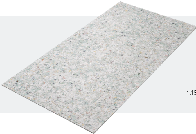
STRONGBOARD FL 1.150 x 600 x 5 mm (LxBxH) Art.-Nr. 2 02 801